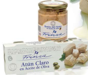
Atún Claro en Aceite de Oliva y Bonito del Norte en Aceite de Oliva